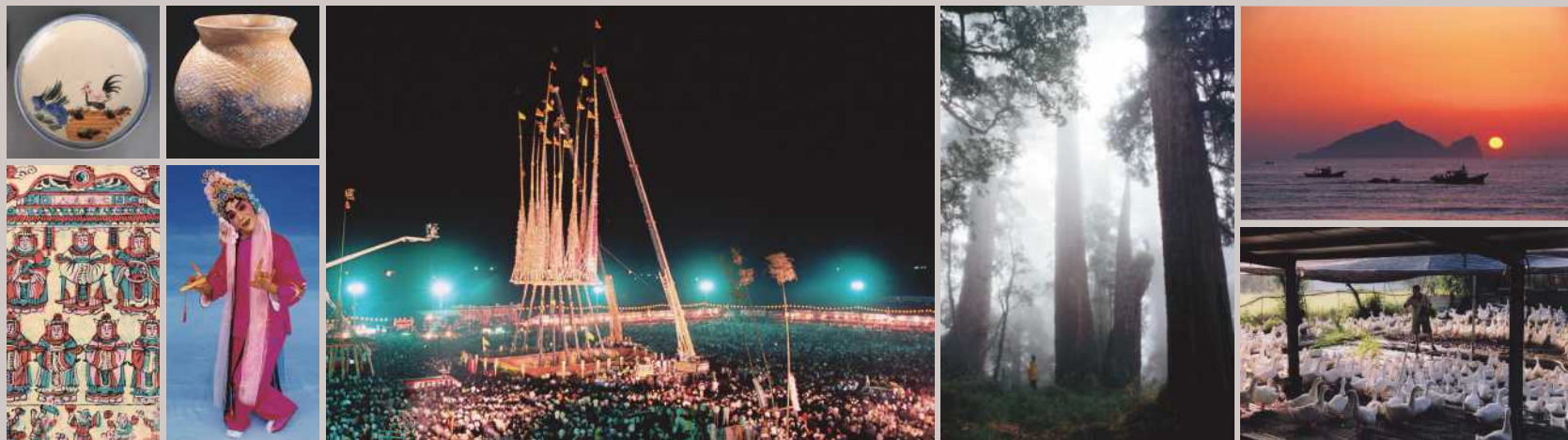
左上より右へ 彩繪公雞紋盤 幾何学紋陶罐 淇武蘭遺跡出土品 頭城搶孤 棲蘭山ヒノキ林 龜山島

宜蘭では四季をテーマとしたイベントも新しいアイデアの下、益々の盛り上がりを見せています、冬に開催される「歡樂宜蘭年」では全国で唯一、旧暦12月最終日の夜(除夕夜)に市民たちが集って共に食事をする機会を設けており、春の「綠色博覧會」では環境保護と省エネルギーを提唱しています。1996年に初めて開催された夏の「宜蘭國際童玩藝術祭」はユネスコの「國際民族芸能組織委員会(CIOFF)」の指標に基づいています。また秋には、文化と保養に重点を置いた「礁溪溫泉祭」、高齢者のためのイベント「宜蘭不老祭」を開催し、観光と生活とのつながりをアピールすることを目的とした活動を行っています。